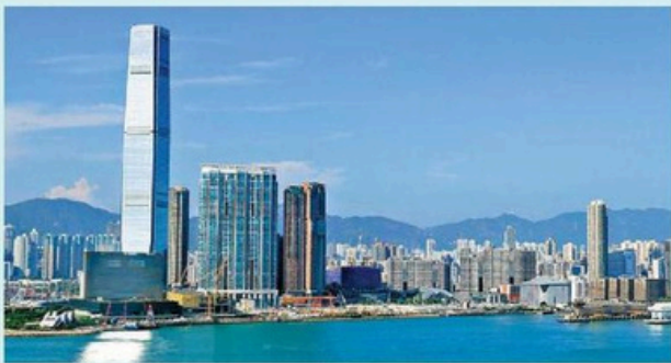
兩項金融相關附屬法例的實施，將有助推動香港金融市場向前發展。