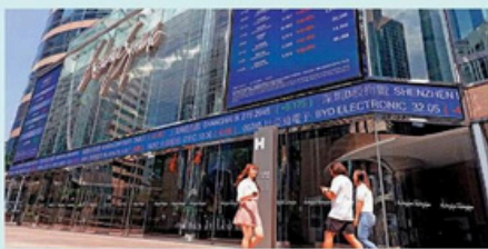
香港可響應國家加快建設金融強國的目標，推動金融高質量發展。